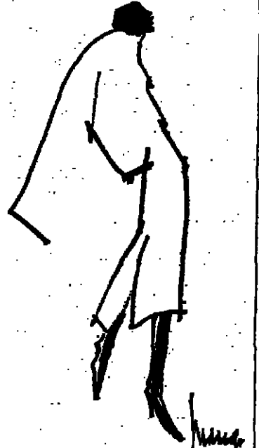
Silhouette 75-76 en haute couture, vue par Marce.